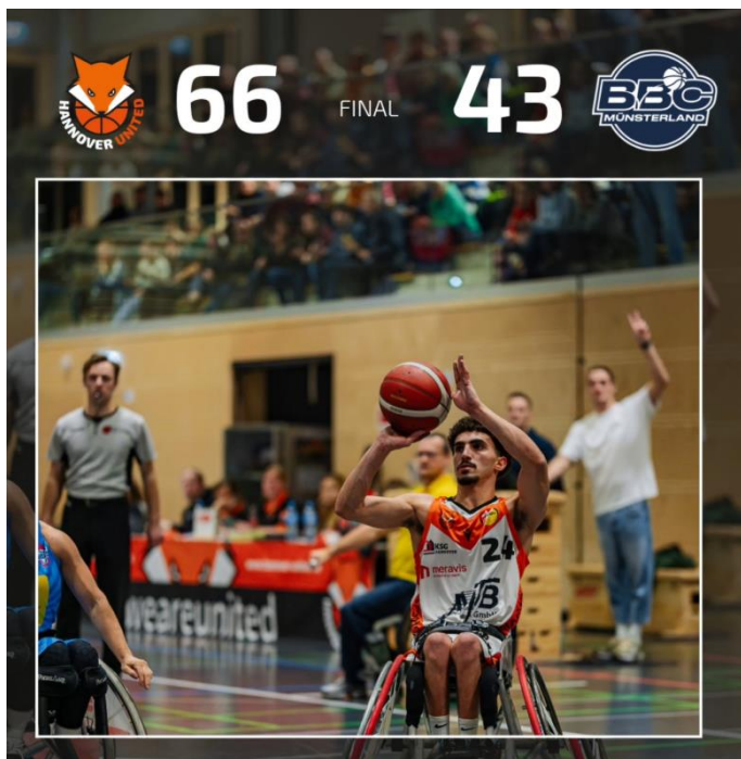
ראדי בפוסט באינסטגרם של קבוצת האנובר