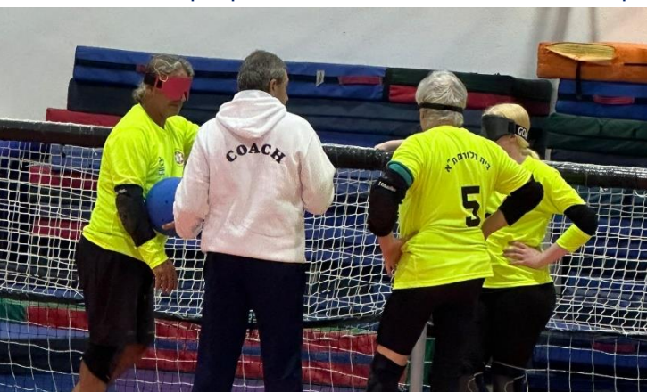
קבוצת העתודה בעמדת הגנה

קבוצת בית הלוחם בהתייעצות בפסק זמן