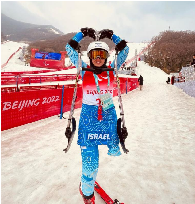
שיינא במשחקי החורף בבייג'ין 2022.

משרד הספורט שותפים לקידום הספורט הפראלימפי