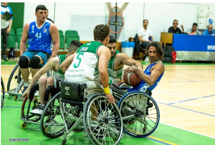
מאבק על הכדור

בבית העליון ישחקו: בית הלוחם באר שבע, בית הלוחם חיפה, בית הלוחם ירושלים, בית הלוחם תל אביב ב', מגיד אל כרום ושלוש ראשון לציון. בבית התחתון ישחקו: הגולן, חוסן באר שבע, כרמיאל ועדי נגב – נחלת ערן.