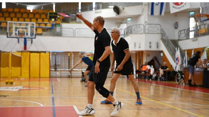
בתמונה, זוג שחקני בדמינטון.