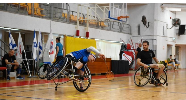
בתמונה, שחקן בדמינטון בכיסא גלגלים מאזן את עצמו.