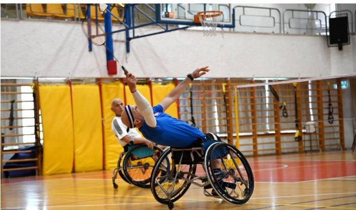
בתמונה, שחקן בדמינטון בכיסא גלגלים מנסה להגיע לכדור.