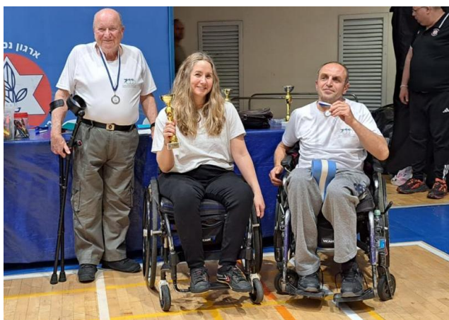
בתמונה הזוכים בריקרב – מסווג.