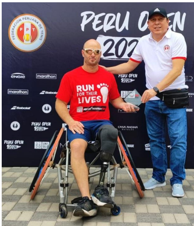
בצילום, אדם עם גביע מהטורניר בפרו